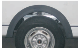
Optie kunststof opzet wielrand