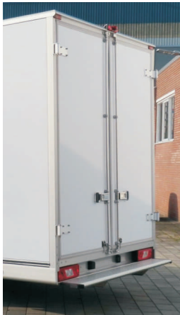
Standaard uitgevoerd met deuren en opstap