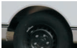
Standaard uitgevoerd met pvc afwerkprofiel