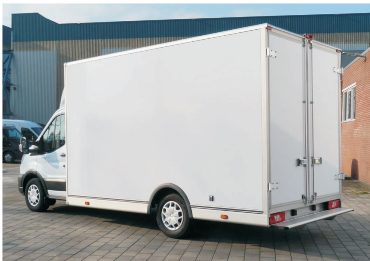
Met achterdeuren met opstap

* Met een standaard achteras is een smallere opbouw mogelijk