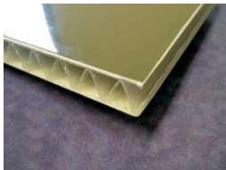
Carbofont 20 mm sterk en slagvast is de 1e keus / gewicht 7.4 kg/m 2

Gemiddeld aantal m 2 bij een 4.30 mtr opbouw zijwanden en kopschot 25 m 2