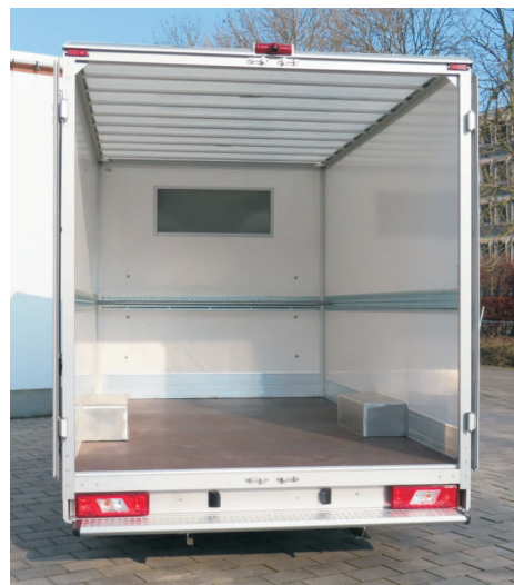
Met opbergruimte onder dakspoiler