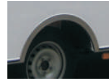
Optie RVS wielrand