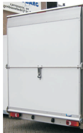
Optie Scharnierbare oploopklep i.p.v.deuren