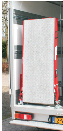
Optie Scharnierbare oploopklep achter deuren